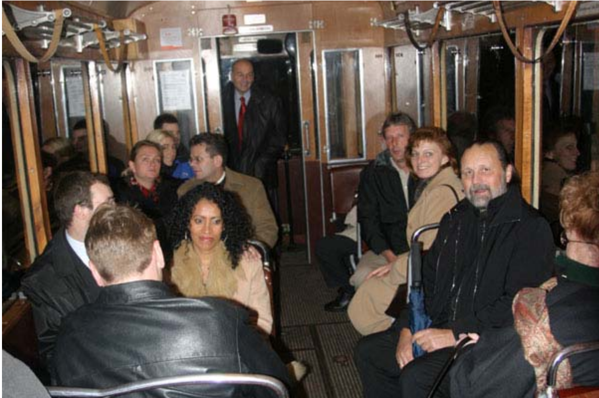
Fröhliche Stimmung auf der Bergfahrt.