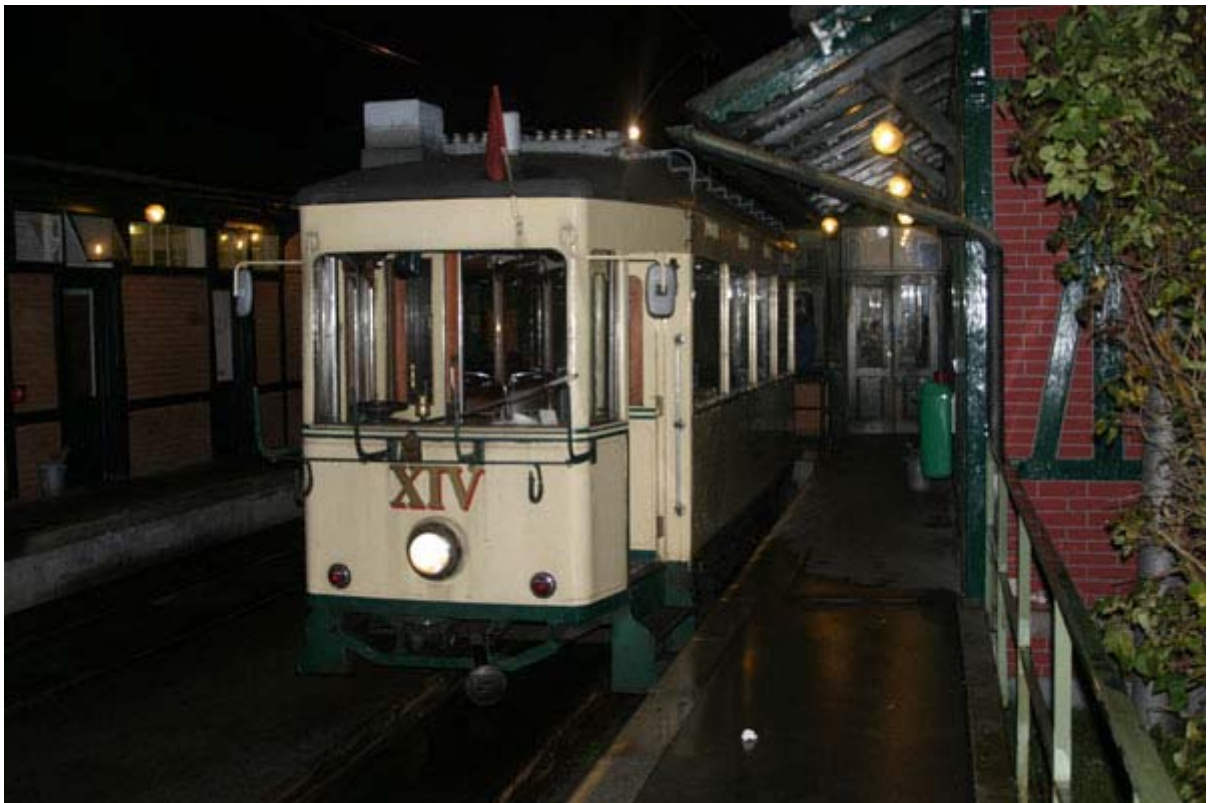
Mit der Pöstlingbergbahn zur festlichen Abendeinladung am Berg.