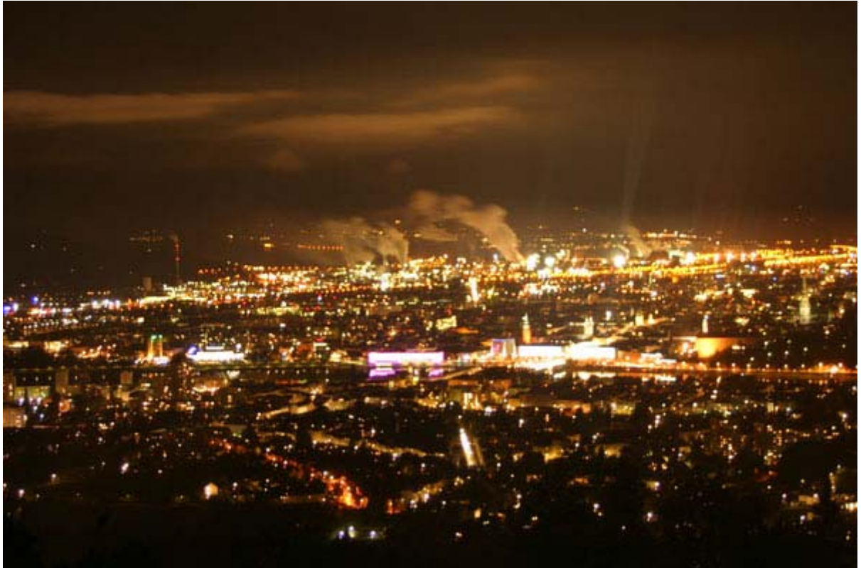
Blick vom Pöstlingberg auf Linz bei Nacht.